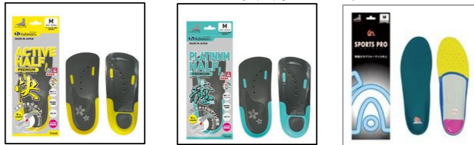
アシマル デイリーハーフプレミアム アシマル プラチナハーフプレミアム アシサプリ スポーツプロ